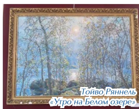
Тойво Ряннель «Утро на Белом озере»