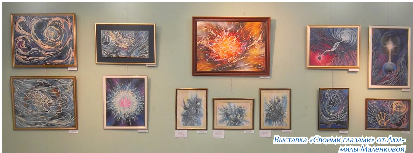
Выставка «Своими глазами» от Людмилы Маленковой