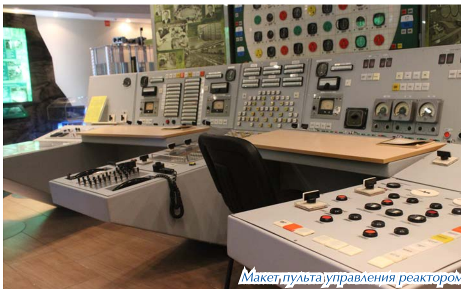
Макет пульта управления реактором

Как говорится, лучше один раз увидеть, чем сто раз услышать. Посетите Музей Горно-химического комбината, и он точно не оставит вас равнодушным!