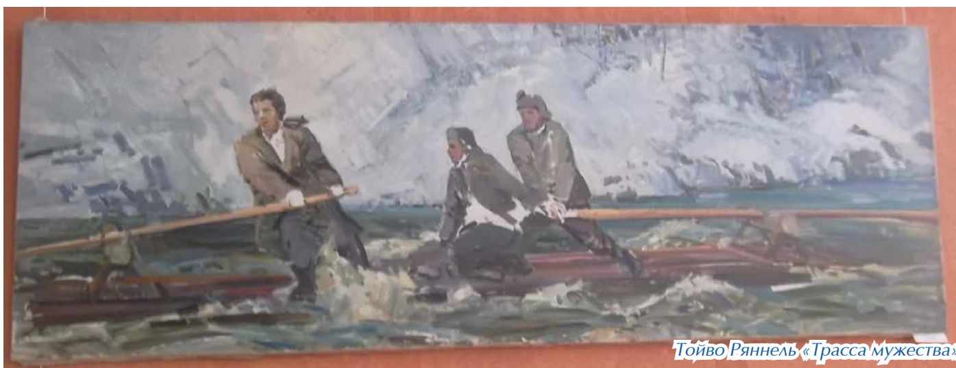
Тойво Ряннель «Трасса мужества»