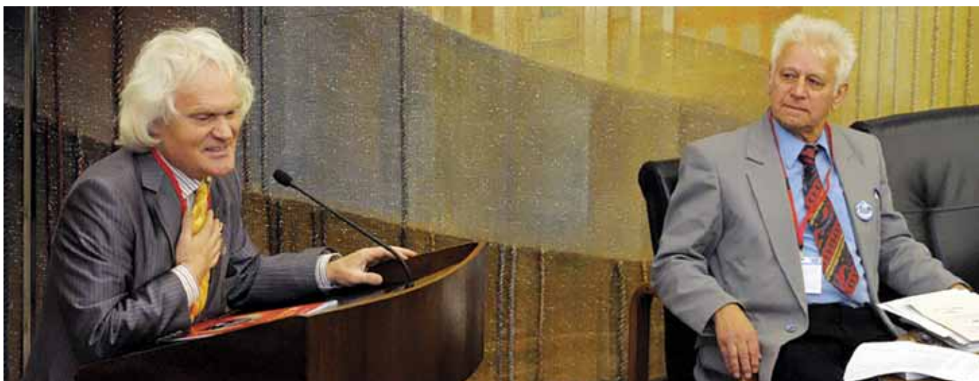
Владимир Филиппович Базарный на Деловом приеме учителей. Москва, 2011 г.