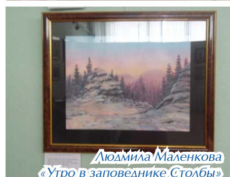
Людмила Маленкова «Утро в заповеднике Столбы»