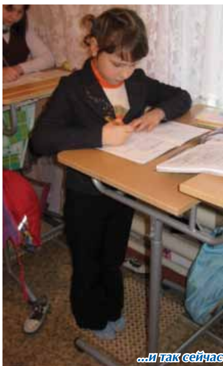
...и так сейчас

стать нашим лицеистам здоровыми и счастливыми.