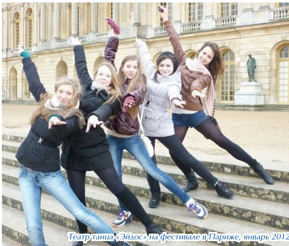
Театр танца «Эйдос» на фестивале в Париже, январь 2012

У театра танца «Эйдос» огромный творческий потенциал и большие перспективы. Остается только пожелать удачи и вдохновения этому талантливому коллективу!