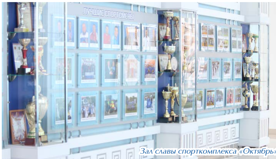
Зал славы спорткомплекса «Октябрь»

Спорт - залог здоровья, которое просто необходимо трудящимся на ГХК. Сотрудники с удовольствием пользуются возможностью заниматься спортом. Комбинат является одним из самых спортивных предприятий среди закрытых городов. И в этом немалая заслуга спорткомплекса «Октябрь»