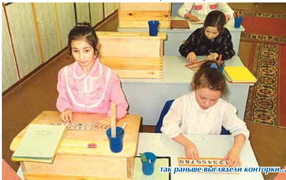
так раньше выглядели конторки...