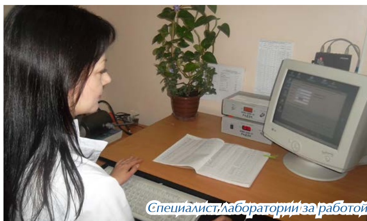
Специалист лаборатории за работой

Стоит отметить, что внешняя радиация является естественной для человеческого организма, а вот при попадании в организм она отрицательно влияет на внутренние органы. Но за всю историю предприятия серьезных превышений нормы зафиксировано не было. И, надеемся, не будет.