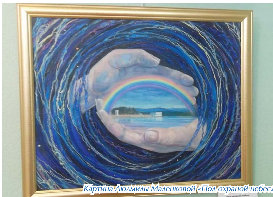
Картина Людмилы Маленковой «Под охраной небес»