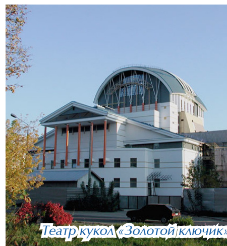
Театр кукол «Золотой ключик»

Театр замечательно показывает себя и на конкурсах и фестивалях. 27 марта, в Международный день театра, он получил «Хрустальную маску» за лучшую премьеру сезона.