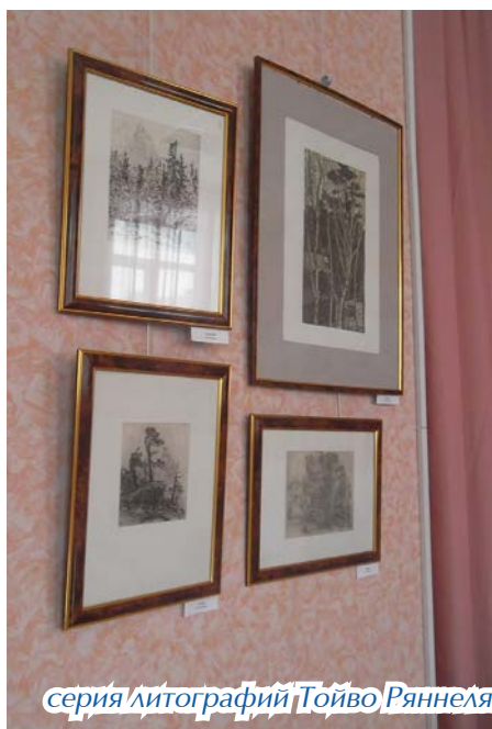
серия литографий Тойво Ряннеля