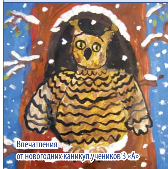
Впечатления от новогодних каникул учеников 3 «А»