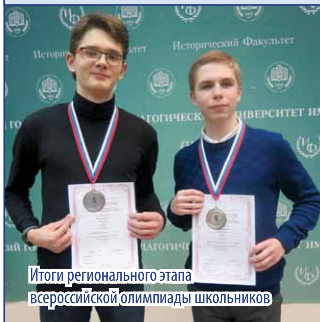
Итоги регионального этапа всероссийской олимпиады школьников